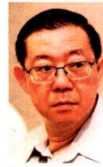
Lim Guan Eng