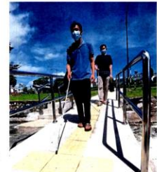
Barriers were constructed around Taman USJ under the city council's barrier-free pilot project for the benefit of the disabled.