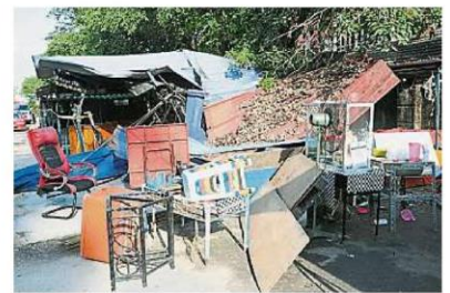
小贩在路边非法搭建的固定结构营业，违反临时小贩准证的条件。

沟渠及建筑物法令第46(1)(a) 条文及第70(13)(c) 条文，向涉及的小贩发出通知通告，以告知在发出通告后的14天之 内，将会拆毁有关建筑物。市政厅将会随时展开联合执法行动，以确保商家遵守条例。