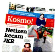
KERATAN Kosmo! semalam.

"Isu pokoknya, masalah jalan berlubang ini memerlukan penyelesaian segera kerana ia