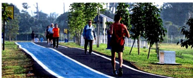
Kajang residents have a new gathering place, Taman Rekreasi Sungai Chua, which was opened on July 1.

This year, there were 4,333 cases and one fatality up to Dec 12, compared to 5,597 cases and seven fatalities last year until Dec 28.