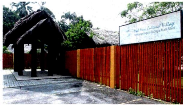
There are 74 Orang Asli villages in Selangor.