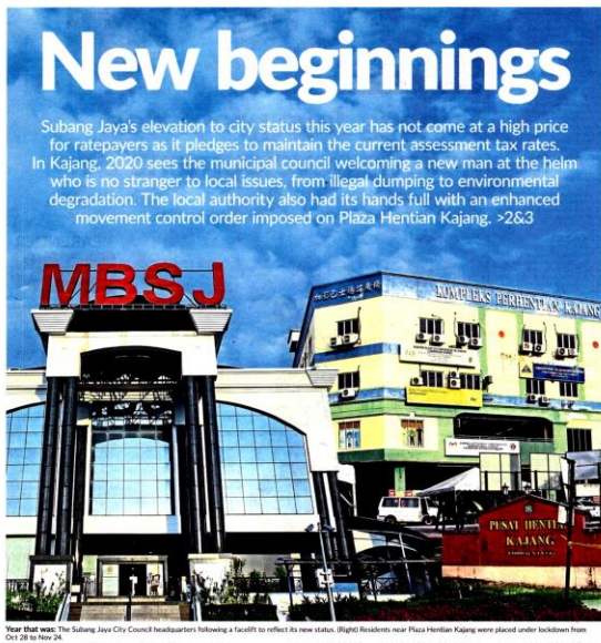
Year that was: The Subang Jaya City Council headquarters following a facelift to reflect its new status. (Right) Residents near Plaza Hentian Kajang were placed under lockdown from Oct 28 to Nov 24.