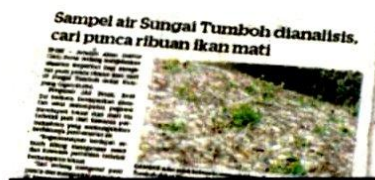
KERATAN Kosmo! 29 Disember 2020.

di kawasan berhampiran Sungai Tumbuh agar menghentikan sementara sebarang aktiviti atas faktor keselamatan ekoran analisa sampel air belum diperolehi pihaknya.