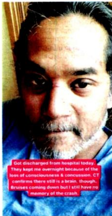
KHAIRY JAMALUDDIN berkongsi gambar terbaharunya di laman Instagram kelmarin.