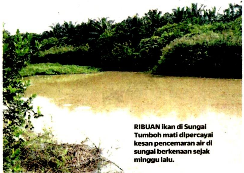
RIBUAN ikan di Sungai Tumbuh mati dipercayai kesan pencemaran air di sungai berkenaan sejak minggu lalu.