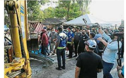
梳邦再也市政厅联合警方和国能公司，展开拆除非法建筑物的行动。