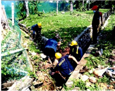
MPAJ workers clearing debris from drains to prevent clogging that can lead to floods.