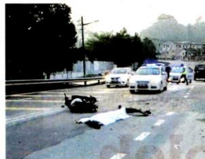
JALAN rosak boleh mengakibatkan kemalangan maut kepada penunggang motosikal. GAMBAR HIASAN

"Jika jalan raya yang tidak diselenggara dengan baik itu di bawah pentadbiran JKR, mangsa yang terlibat kemalangan boleh membuat tuntutan ganti rugi dan keputusan sama ada perlu membayar ganti rugi akan ditentukan