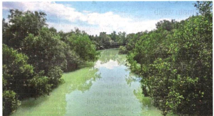
Keadaan Sungai Buloh yang berwarna gelap dipercayai akibat dicemari sisa pencemaran industri.

Menurut dokumen itu, lembangan Sungai Buloh yang menjadi antara lembangan utama di Selangor mengalami penurunan kualiti air berikutan pembangunan perindustrian dan komersial yang pesat di kawasan persekitarannya.