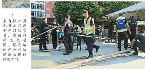
↑ 再 → 拆 自 邦 再 也 市 政 府 的 官 員 們 在 蒲 種 柏 邁 交 通 圓 錐 塔 瓦 路 的 部 分 非 法 建 築 物 進 行 拆 除 工 作。