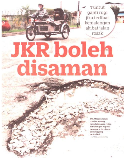
Tuntut ganti rugi jika terlibat kemalangan akibat jalan rosak